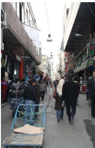
کوچه برلن

اضافه کردن الحاقات به ساختمان، کانال کشی و نصب کولر در مقابل پنجره ها و نمای ساختمان و سیم کشی نامناسب از عوامل اغتشاش سیمای جداره ها در محدوده هستند. عدم وجود نظم در