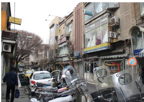
کوچه مهران

کرمونا موضوعات پایه در خصوص مفاهیم واحد همسایگی را شامل اندازه، مرزها، معنا و ارتباط اجتماعی و اختلاط اجتماعی و جوامع متعادل معرفی کرده است که در زیر به بررسی آنها در محدوده لاله زار پرداخته شده است.