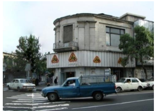
سینما تابان - منبع: نگارندگان

در مورد معلولین می توان گفت بیشتر ساختمانها، قابل دسترس برای افراد روی صندلی چرخ دار نیستند. مخصوصاً تمهیدات اندیشیده شده به منظور جلوگیری از ورود خودرو به درون کوچه های پیاده متاسفانه ورود افراد معلول را نیز مشکل مواجه کرده است و همچنین وجود تابلوهای چشمک زن که تقریباً در تمام سکانس ها قابل رویت است، بیماران صرعی را با خطر حمله عصبی مواجه می کند البته این مشکل در روز چندان خودنمایی نمی کند.