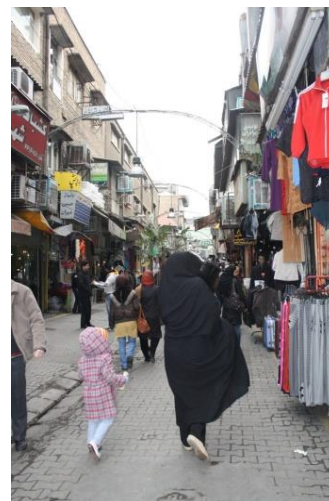
کوچه رفاهی

به طور کلی محدوده بافت مرکزی تهران و به تبع آن لاله زار محدوده ای یکپارچه و متعادل نیست و نمی توان آن را به عنوان یک کل یکپارچه درک کرد و در محدوده لاله زار قشرهای گوناگونی از مردم همزمان با هم حضور دارند و به کار و فعالیت مشغولند به همین دلیل نمی توان محدوده را به گروه یا طبقه خاصی نسبت داد با این حال به دلیل اینکه عمده فعالیت های محدوده به کالاهای الکتریکی اختصاص دارد از لحاظ عملکردی قابل جداسازی از بافت اطراف خود هست. به دلیل اینکه محور لاله زار یک محور با وجه ی تجارتي قوی است و فروشندگان و خریداران، دو گروهی هستند که چهره غالب رفتاری محور را تشکیل می دهند و در کنار کارکنان تولید، رانندگان، کلیت الگوی رفتاری در محور را می سازند.