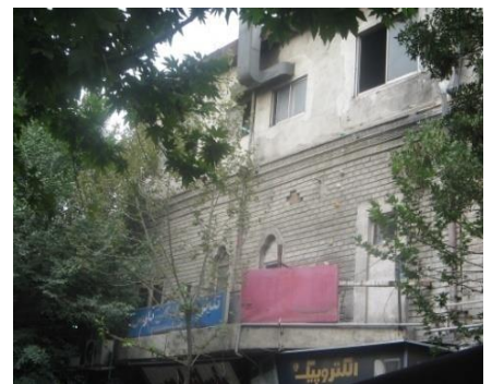
سینما ایران