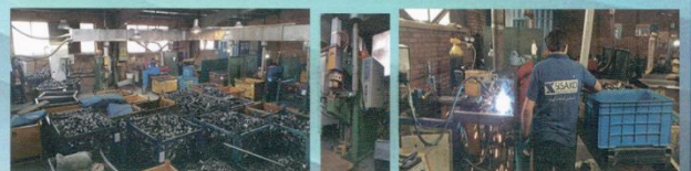
مونتاژ انواع قطعات فلزی