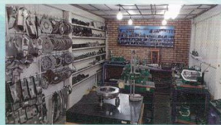
واحد کنترل کیفیت