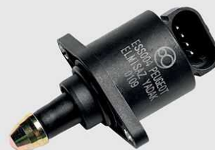
پژو ۴۰۵، سمند، پرشیا