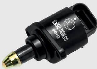
پژو ۴۰۵، سمند، پرشیا