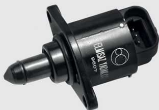
پراید، پیکان، آریسان، پیکان وانت تیبا، پژو ۲۰۶ (TU5), EF7, RD