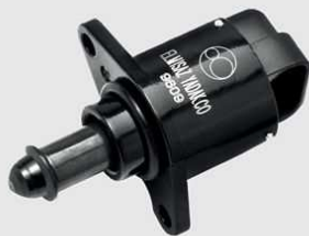
پژو ۲۰۶ تیپ ۲