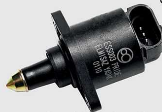
پراید، پیکان، آریسان، پیکان وانت تیبا، پژو ۲۰۶ (TU5), EF7, RD