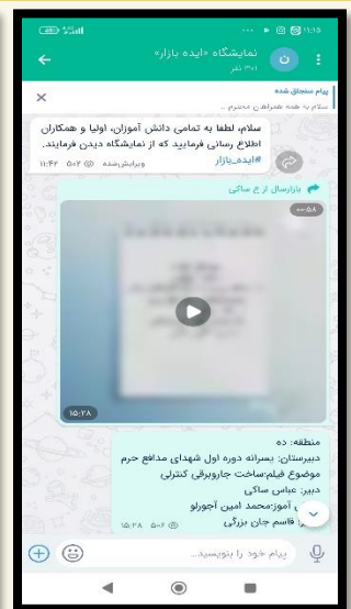
برگزاری نمایشگاه مجازی ایده بازار تهران