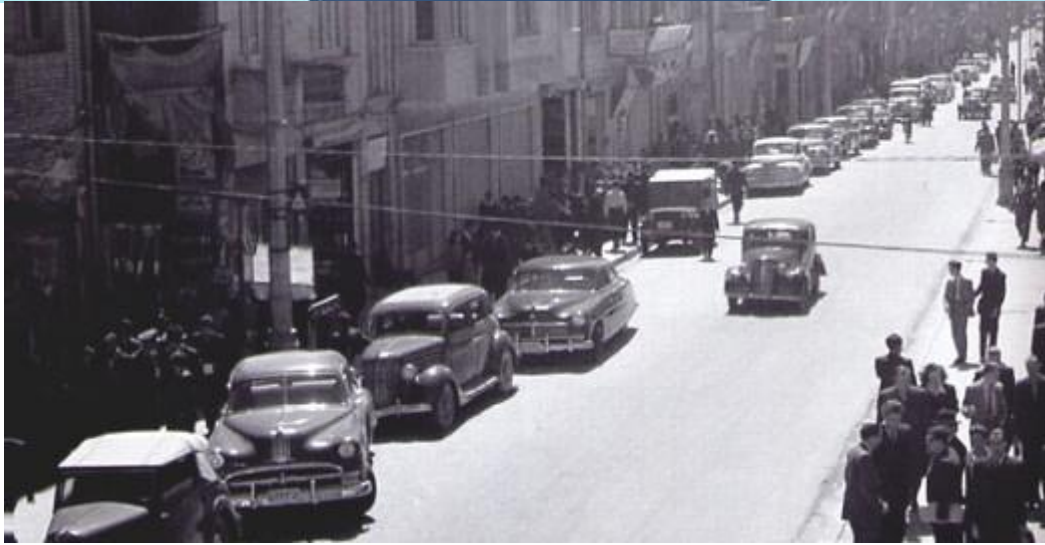
خیابان لاله زار در دوره پهلوی دوم