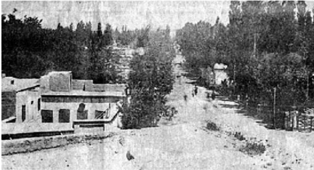
باغ لاله زار

باغ لاله‌زار در داخل بافت قرار می‌گیرند و تقسیم‌بندی خیابان‌ها در تهران مورد توجه قرار می‌گیرد که همانند شهرهای به صلیب کشیده شده اروپائی می‌شود. اعتمادالسلطنه در این خصوص می‌نویسد: