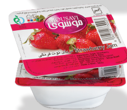
مربای توت فرنگی