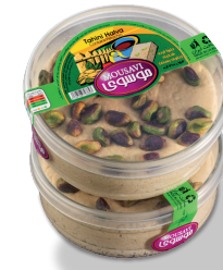
حلوارده (حاوی پسته)