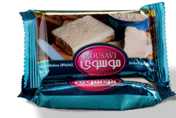
حلوارده (ساده ۵۰ گرمی)