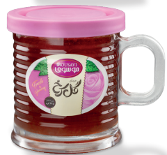
مربای گل سرخ