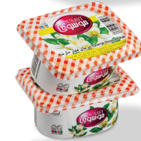
مربای بهار نارنج