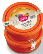
مربای هویج زعفرانی