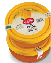
مربای زرد آلو

وزن: ۳۵۰ گرم ■ تعداد در کارتن: ۲×۶ ■ وزن ناخالص کارتن: ۸/۵۰۰ کیلوگرم