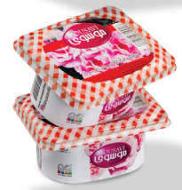
مربای گل سرخ