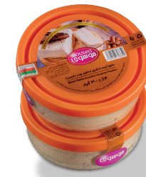
حلوارده (حاوی پودر دارچین)