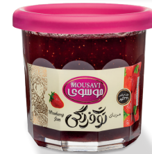
مربای توت فرنگی