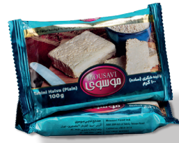
حلوارده (ساده ۱۰۰ گرمی)