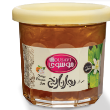
مربای بهار نارنج

وزن: ۳۲۰ گرم ■ تعداد در کارتن: ۶×۲ ■ وزن ناخالص کارتن: ۷/۳۰۰ کیلوگرم