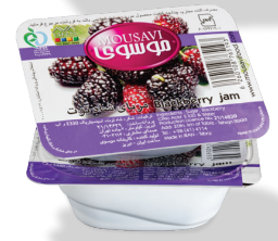
مربای شاه توت