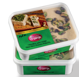
حلوارده (با مغز پسته)