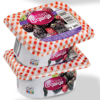
مربای شاه توت