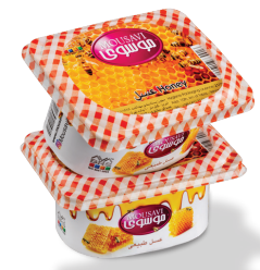
طرح موسوی (۲۲۵ گرم)