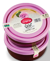
مربای گل سرخ