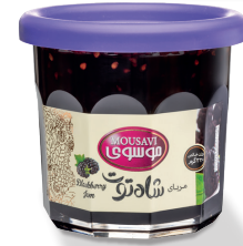
مربای شاه توت