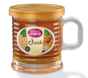
طرح ویکتوریا (۲۴۵ گرم)