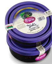
مربای شاه توت