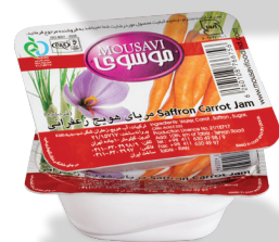
مربای هویج زعفرانی

وزن: ۱۱۵ گرم ■ تعداد در کارتن: ۴۸ ■ وزن ناخالص کارتن: ۶/۵۰۰ کیلوگرم