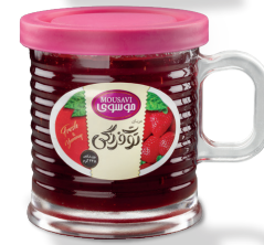
مربای توت فرنگی