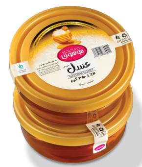
طرح ویترا (۳۵۰ گرم)