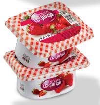
مربای توت فرنگی