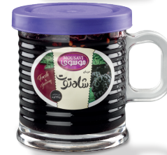
مربای شاه توت