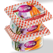
مربای هویج زعفرانی