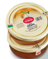
مربای بهار نارنج