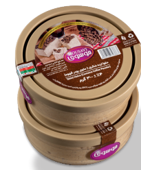
حلوارده (حاوی پودر قهوه)