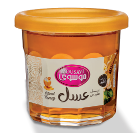
طرح الیزابت (۳۲۰ گرم)