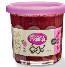
مربای گل سرخ