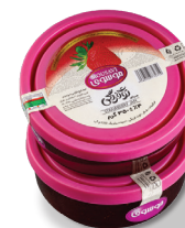
مربای توت فرنگی