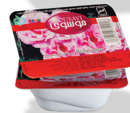
مربای گل سرخ